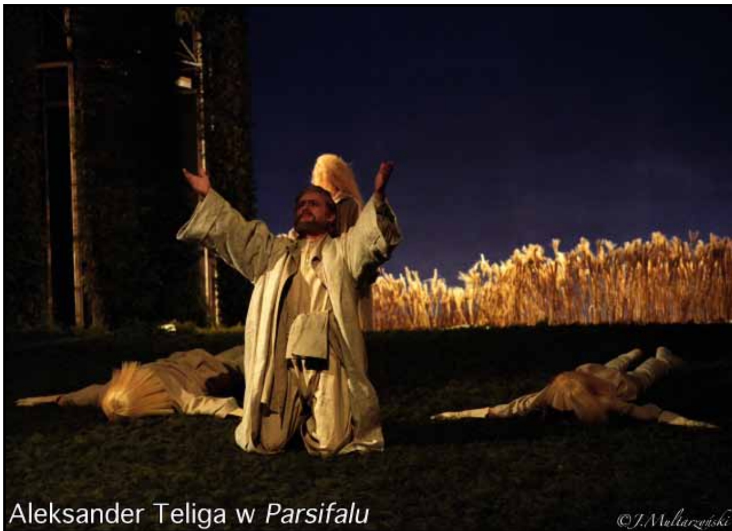
Aleksander Teliga w Parsifalu

Polski śpiewak, zaliczany do czołówki europejskich solistów. Ukończył wydział wokalnno-aktorski w konserwatorium we Lwowie w klasie śpiewu A. Wrabiał Gościł na scenach takich teatrów jak: Gran Teatro La Fenice, Royal Theatre Dublin, Teatro Nacional de Sao Carlos, Opera Praska, Staatsoper Berlin, Opera National de Lyon, Teatro Comunale di Bologna, Teatr Bolszoi. Jako jedyny polski artysta zaśpiewał trzydzieści sześć razy na scenie mediolańskiej La Scali. Występował w gronie światowej sławy śpiewaków m.in. Eleny Obrazcowej, Dmitrija Chworostowskiego, Kurta Rydla, Paola Gavaniego, Dagmar Schellenberger, Daniela Dessi, Giovaniego Bartoliniego, i dyrygentów takich jak: Vladimir Jurowski, Jurij Temirkanow, Daniele Gatti, Daniel Barenboim, Kazushi Ono, Aleksander Ansimov. Dwukrotnie otrzymał „Złotą Maskę“ Nagrodę Artystyczną Marszałka Województwa Śląskiego za role de Silvy w Ernanim Verdiego Mefista w Fauście Gounoda.